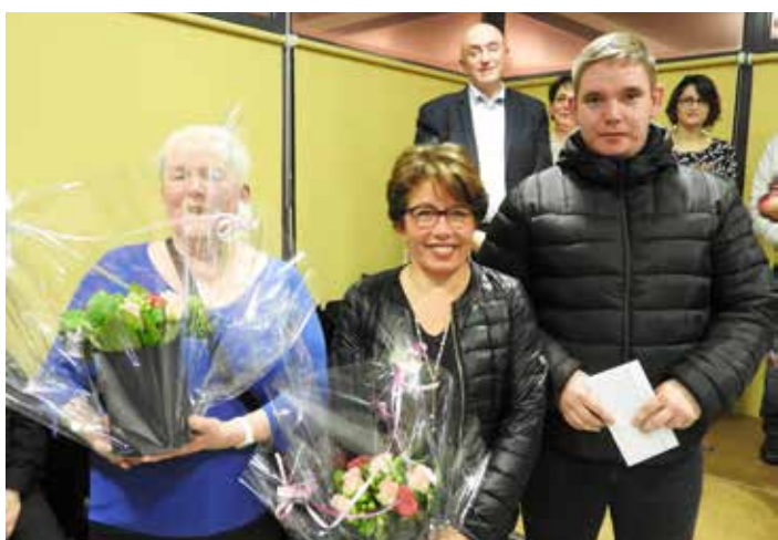
Cérémonie des vœux 2020.